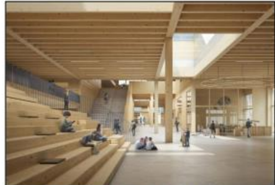
Perspektiv som viser omfi i allmenningen og hovedtrapp til plan 2