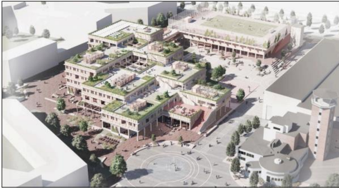
Perspektiv - Terminalen