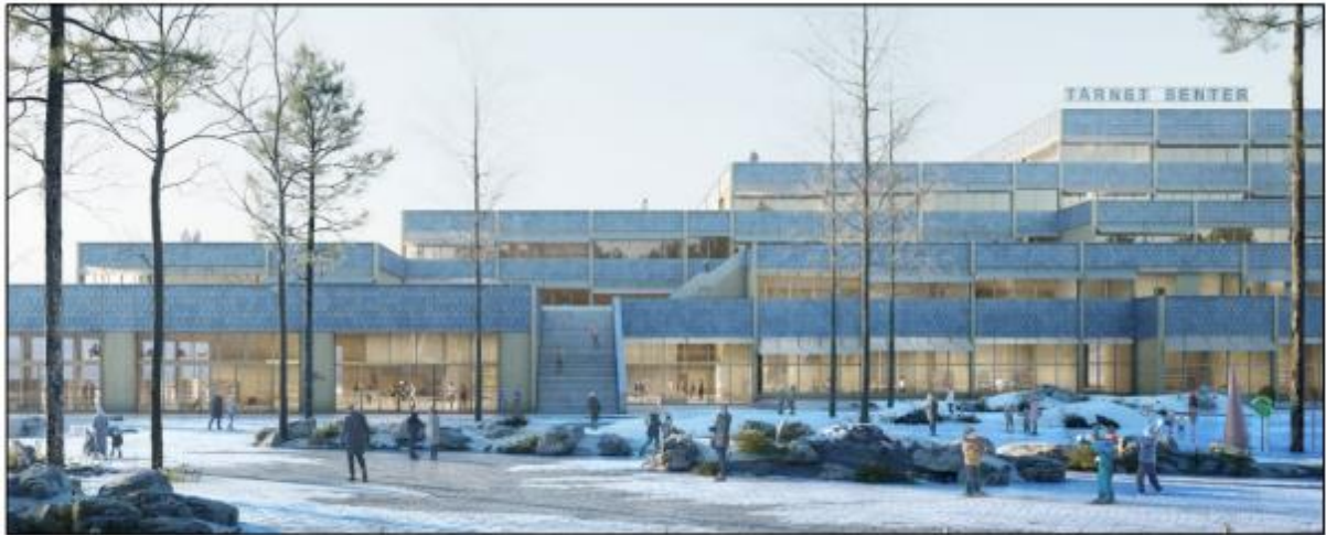
Perspektiv – Tårnet senter