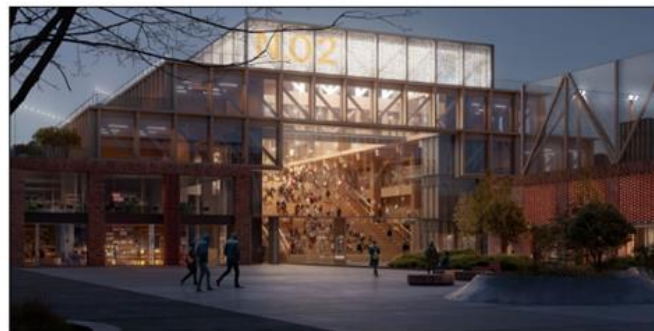
Perspektiv - Fra Hangarplassen til Tårnkvartalet