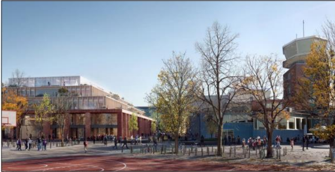
Perspektiv - Aktivitetsparken mot Tårnkvartalet

Team 1 Tårnkvartalet. Pir II Oslo AS (med Haptic Architects AS)