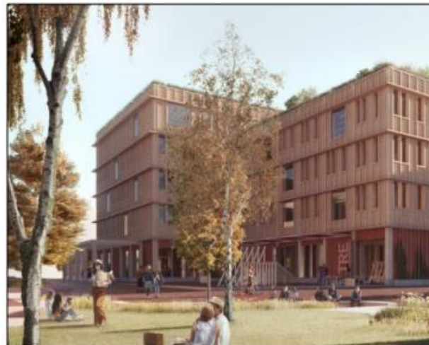
Perspektiv mot byggets fasade mot boligområdet - Terminalen