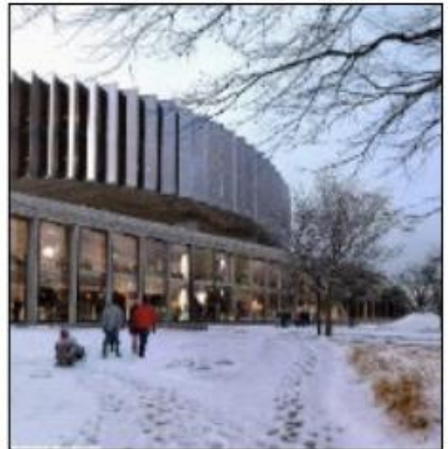
Hovedinngang - Det flyvende teppet