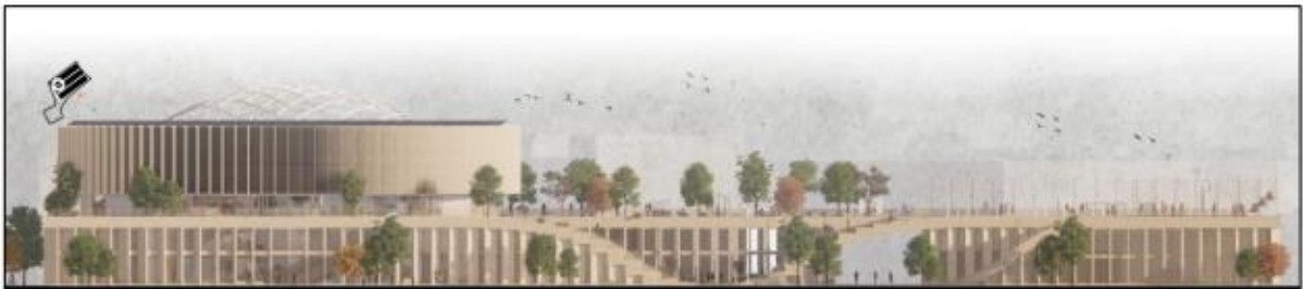
Fasade - Det flyvende teppet