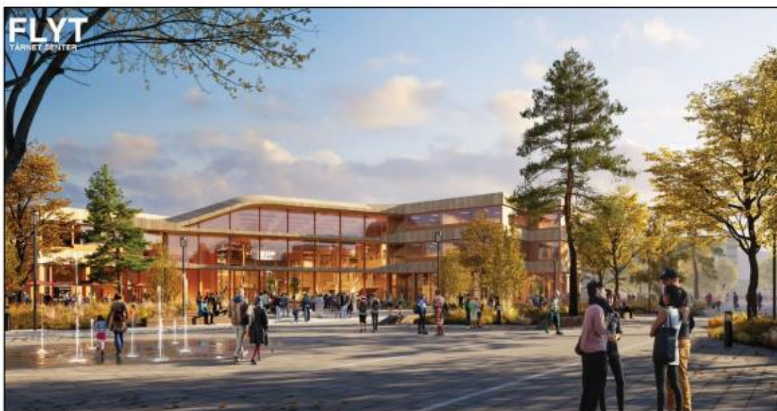
Perspektiv – Flyt