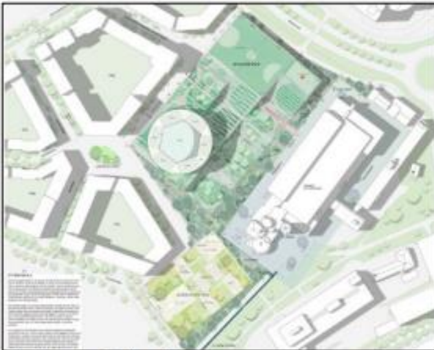
Situasjonsplan - Det flyvende teppet