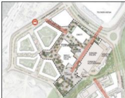
Diagram - Terminalen