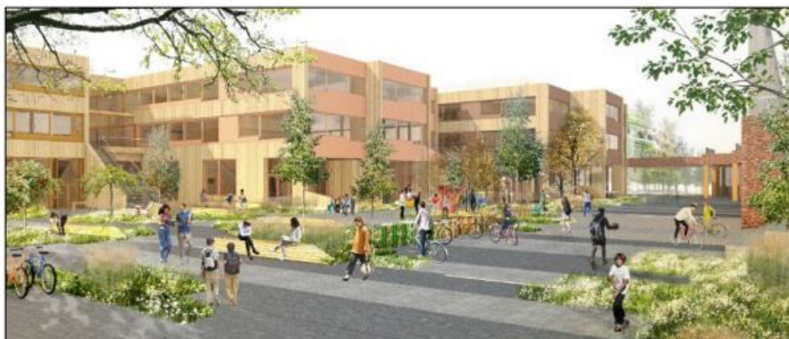
Perspektiv - Tverrstripen